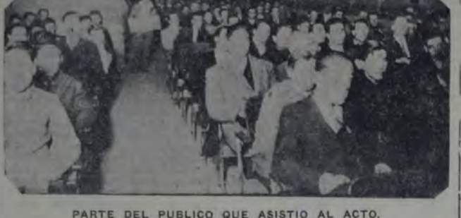
PARTE DEL PUBLICO QUE ASISTIO AL ACTO.