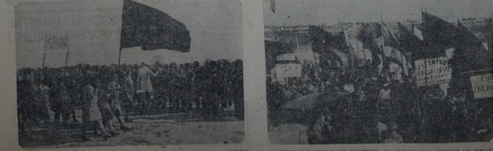
CABEZA DE LA MANIFESTACION AL INICIARSE EL DESFILE EN LA FIESTA DE LA JUVENTUD AL TERMINAR EL DESFILE, LAS JUVENTUDES SE AGRUPAN PARA ESCUCHAR LOS DISCURSOS

Con los auspicios de la Comisión de Cultura de la Casa del Pueblo, el doctor Max Birabén disertará mañana martes, a las 21 horas, en el salón de conferencias de la Casa del Pueblo, sobre "Las organizaciones sociales en el mundo de los insectos", ilustrando la conferencia con proyecciones luminosas.