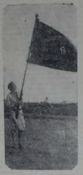
"LA INTERNACIONAL SERA LA HUMANIDAD!..."

Tal como se esperaba, dado el gran entusiasmo con que se realizaron los trabajos preliminares, es decir, grandiosa e imponente dentro de su sencillez, y digna en todo su honorabilidad moral, ha resultado la Fiesta de la Juventud organizada por el Comité central de la Confederación Juvenil Socialista.